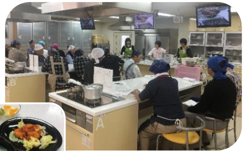
↑ 調理前の様子 ← 中華（エビチリなど）

前期と後期に分けて、それぞれ月 1 回の 3 回連続講座で、洋食・和食・中華料理を作りました。真剣に調理台と向き合い、試食タイムには料理について談笑される様子もあり、皆様とても楽しんでいただけたようでした。