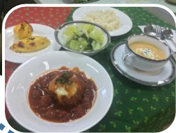
↑ 調理の様子 ← 洋食（煮込みハンバーグなど）

参加者の皆様へのアンケートでは、全ての参加者が「参加してよかった」と回答いただきました。また、「長く続けてほしい」、「3回ともおいしくいただきました」、「災害時のボランティアとして参加し支援できるようになりたい」、「今回はこれまでより、よりよかったと思う」といった感想をいただきました。