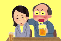
異性愛を前提とした質問・無意識なセクハラ言動