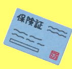
保険証性別欄・病院で呼ばれる名前 (外見との不一致)