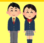
学校の制服 (男子：ズボン 女子：スカート)