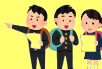
修学旅行 (部屋割り)