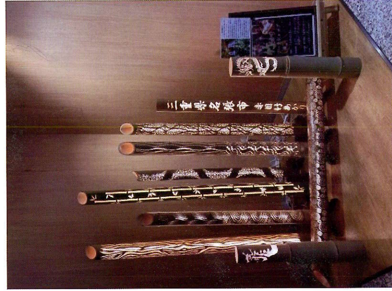
多くの方を魅了した竹あかりの展示

この機会に名張市に興味を持ってくださった方が、実際に足を運んでくれることを期待しています。