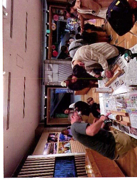
竹あかりを製作する参加者たち