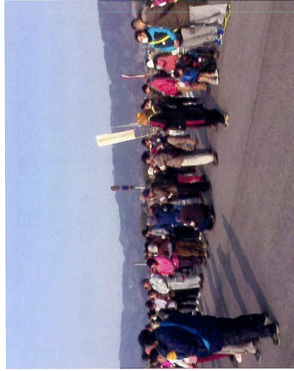
以前のふるさとウォークの様子