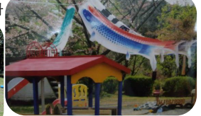
鯉のぼりとあづまや

ンティアメンバーが環境美化に取り組むという仕組みになっていて、情報交換の場としても活用し清掃後の親睦タイムも楽しいということでした。公園に案内していただきましたが、今年から世代間交流のイベントとして、5月に鯉のぼり作り、7月には七夕飾り、12月の餅つき大会と和気あいあいと交流の場を楽しんでいるようです。取材当日は七夕の笹が立てられ短冊が風でなびいていました。自治会は、「あったかい番町」で、親睦会は、広い公園の活用で「軽度のスポーツ」や「ビンゴゲーム」「家族抽選会」と役員が企画したイベントで懇親会を行っているということでした。お話の中で、北2番町にはつつじが丘住宅を支える地域リーダーが多く住んでおられるということも分かりました。(広報部)