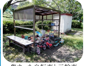
集まった自転車と三輪車