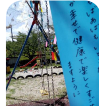
願いが書かれた短冊