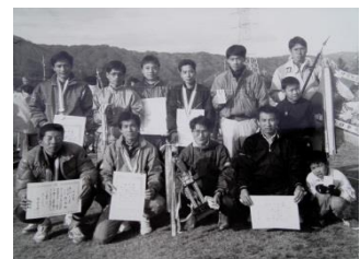
優勝した当時のメンバー