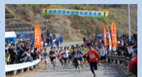
第31回大会 スタート時の模様