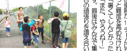
このプログラムはこれまで遠くからのリクエストが多く、楽しんでいた。集会所から今年優勝を勝ち取ろうと、作戦会議が始まる程の意気込みです。