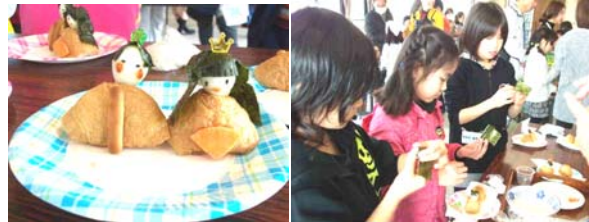
「百合小こどもクラブ」活動報告