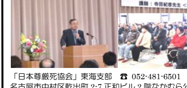
3月4日の講演会の様子 「日本尊厳死協会」東海支部 ☎ 052-481-6501 FAX052-486-7389 名古屋市中村区乾出町2-7 正和ビル2階なかむら公園前法律事務所内

或いは回復不能の かんえんせい意識障害(植物状態)等で延命措置を拒否し尊厳ある生き方を求める尊厳死運動が起きました。この流れに沿って日本でも1976年(昭和51年)日本尊厳死協会が誕生しました。尊厳死に関する法律はまだありませんが、皆様にも知ってほしい」と話されました。