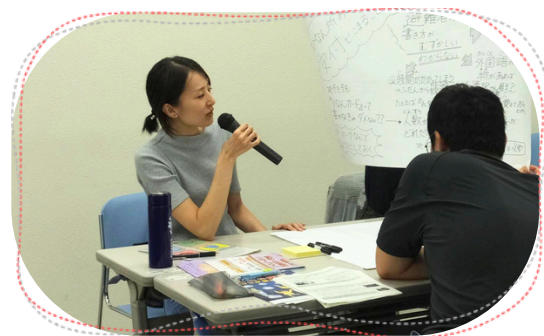
「名張外国人防災リーダーズスキルアップ研修」にて

日本語教室でも、伝わったと思っていても伝わってなかったり、伝わっていないだろうと心配していたことが伝わってたりします。言葉はコミュニケーションのためのツールですが、言葉だけでなく、伝えたい・理解したいという気持ちでつながることが大切だと思っています。