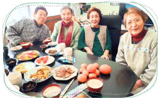
班会では食卓を囲みます

世の中には、気候危機や世界情勢など大きなことから、健康や経済的な問題などの身近なことまで、不安がいっぱいです。だからこそ、日々の課題の一つひとつ丁寧に向き合い、今自分にできること・やりたいことをやっていくことが大切だと思います。