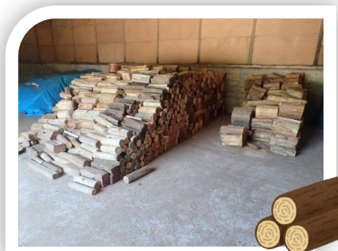
流木の玉切り(薪)の状況