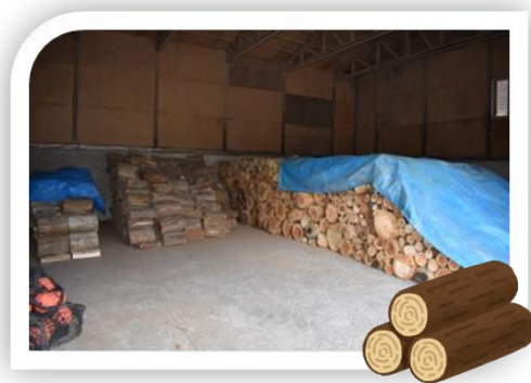
流木の玉切り(薪)の状況