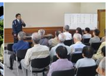
比奈知高齢者学級