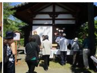
ひなち歴史民俗講座