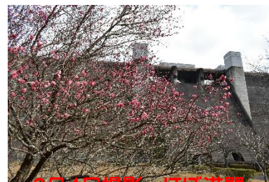
2月4日撮影 ほぼ満開